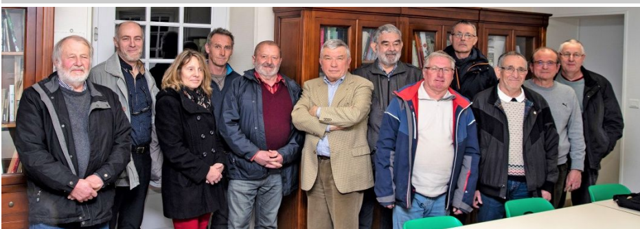
Photo des membres présents à l'issue de l'élection